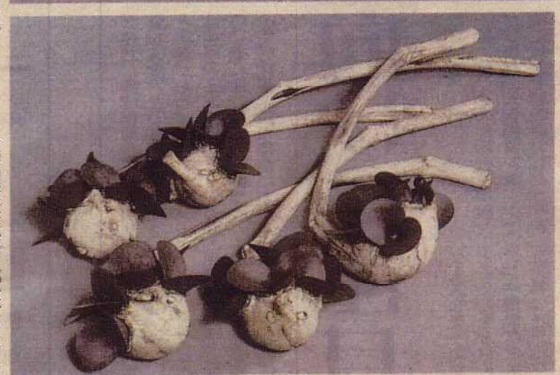
優秀作品賞 「春二想フ」