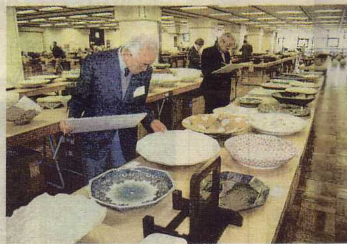
作品をチェックする審査員—東京都港区内の審査会場で

「第18回日本陶芸展」(毎日新聞社主催)の審査が行われ、入賞・入選作計198点が決まった。前回より100点多い1100点の公募作品と招待作家28人の作品の中から「実力日本」の作品として、崎山隆之の「扁壺『聴涛』」が大賞(桂宮賜杯)に輝いた。入賞・入選と招待作家の作品は、東京と大阪で展示される。東京展は5月12、24日、大丸ミュージアム・東京。京都千代田区丸の内1の9の1。大阪展は6月1、6日、大丸ミュージアム・心齋橋(大阪中央区心齋橋筋1の7の1)。(敬称略)