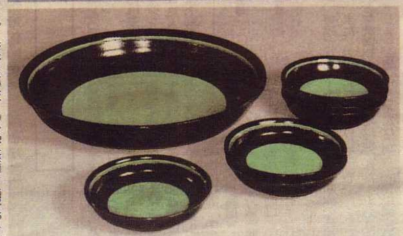
優秀作品賞 「掛分組浅鉢」